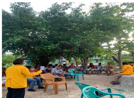
Gambar 2. Penyuluhan secara tatap muka langsung dengan masyarakat RT 20, Kelurahan Lasiana, Kota Kupang

Berdasarkan diskusi dengan warga dan hasil pengisian kuesioner sebelum pemaparan materi diketahui bahwa hampir semua warga sudah pernah mendengar tentang penyakit Hog cholera , namun pengetahuan mereka mengenai virus ini hanya sebatas virus dapat menular antar babi dan dapat menyebabkan kematian pada ternak babi, namun mereka belum pernah mendapatkan informasi lebih lanjut mengenai apa sebenarnya penyakit Hog cholera , penyebab, cara penularan, pencegahan dan pengendalian dari penyakit ini.